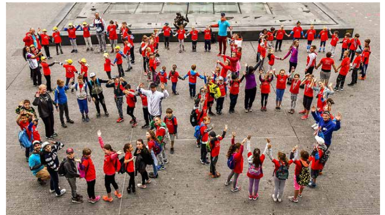
Olympijský deň 22. 6. 2018 Eurovea